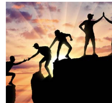
Veilig vangnet waar dat (nog) ontbreekt