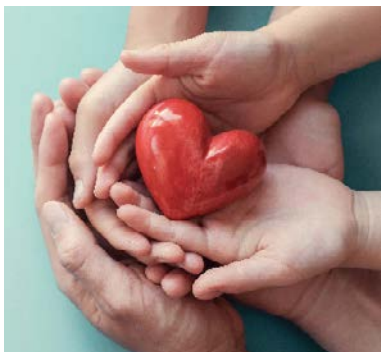
Voorvechter gelijke kansen op een goede gezondheid

In 2024 volgt een tussentijdse evaluatie van de visie. Waar nodig worden ambities aangescherpt of accenten verschoven. Wanneer de tussentijdse evaluatie gereed is bekijken we in hoeverre de uitkomsten ook leiden tot een aanpassing van deze bestuursagenda.