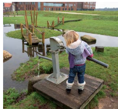
Adviseur voor een gezonde leefomgeving