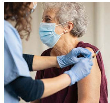
Regionale partner acute problemen publieke gezondheid